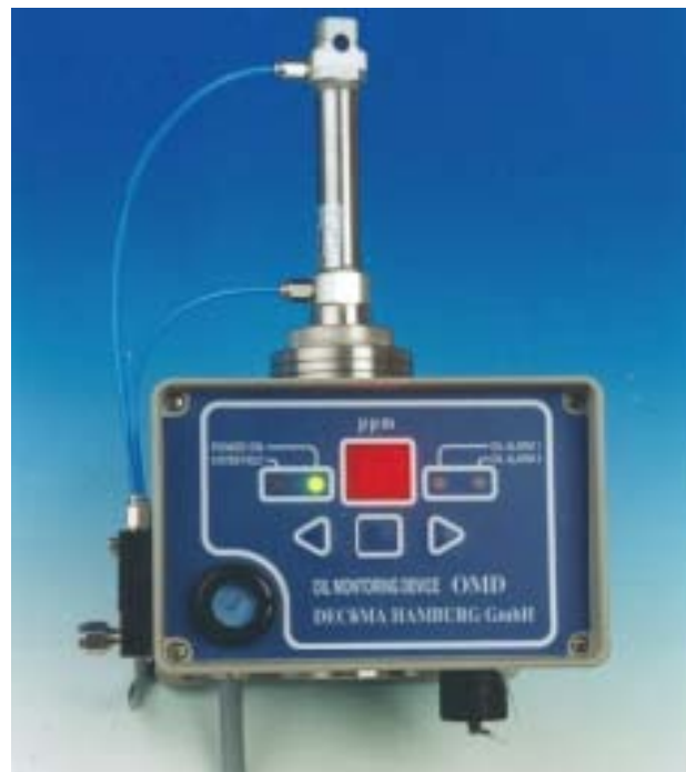
Model OMD-17 with Manual Clean Unit