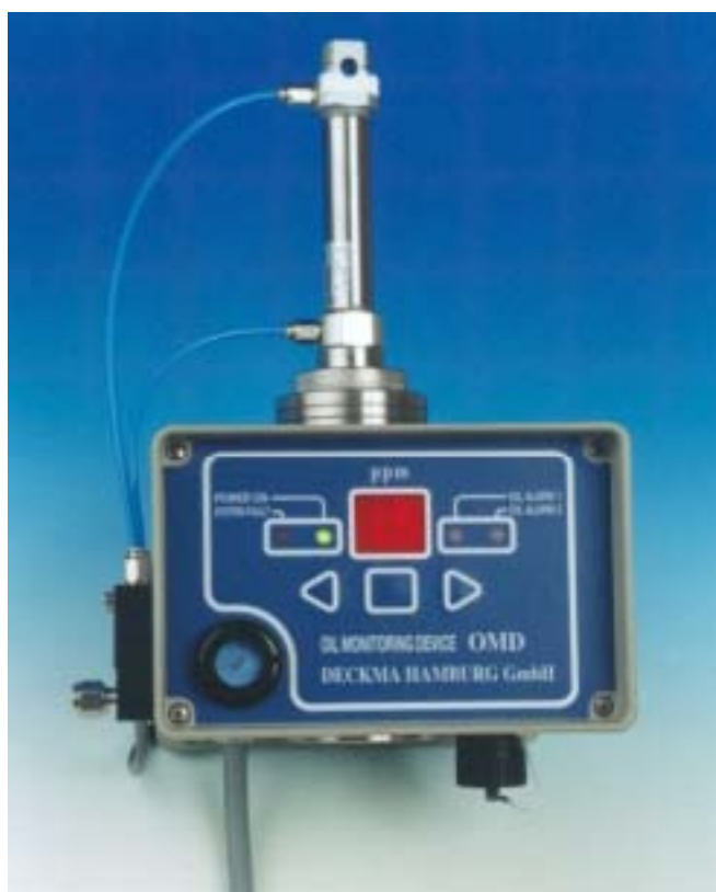
Model OMD-15A with Autoclean System